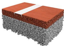
Sistem Conipur Pro Clay (pentru terenuri indoor si outdoor)

Pentru amenajarea unui teren de tenis, Indfloor Group va pune la dispozitie pardoseli poliuretanic tip tartan, gazon sintetic, sau: